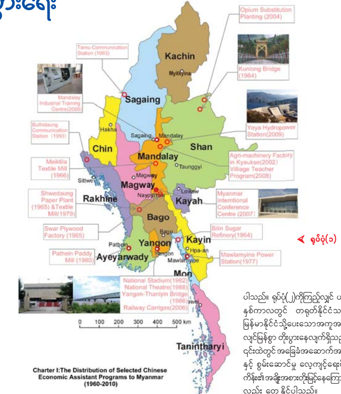
Charter I: The Distribution of Selected Chinese Economic Assistant Programs to Myanmar (1960-2010)

ပေးခဲ့ပါသည်။ ၎င်းလေ့ကျင့်ရေးမှာ စီးပွားရေးနှင့် ကုန်သွယ်ရေး နိုင်ငံခြားရေး၊ ပြည်သူ့ရေးရာ စီမံခန့်ခွဲရေး (Public Administration)၊ ကျန်းမာရေး၊ ပညာရေး၊ ပြန်ကြားရေး၊ ယဉ်ကျေးမှု ပတ်ဝန်းကျင်ထိန်းသိမ်းရေး ဆက်သွယ်ရေး၊ ဘဏ္ဍာရေး၊ စွမ်းအင်ပညာပိုင်းနှင့် စသော နယ်ပယ် ၂၀ ကျော် အကူအညီပေးပါသည်။ မြန်မာနိုင်ငံအတွက် အင်ဂျင်နီယာပညာရှင်များ စွာ မွေးထုတ်ပေးသည်။ ၂၀၀၃ ခုနှစ် တည်ဆောက်သော မန္တလေးစက်မှု နည်းပညာလေ့ကျင့်ရေးဌာန၊ ၂၀၀၄ ခုနှစ်တွင် ဆောင်ရွက်သော ပါဝင်နှင့် ကြုံပင် ဖျိုးကောင်းဖျိုးသန့်ဗွေထုတ်ရေးနှင့် စိုက်ပျိုးရေးနည်းပညာလေ့ကျင့်ရေးသင်တန်း မြန်မာနိုင်ငံ မဟာဓာတ်အားလျှောစီမံကိန်း၊ ၂၀၀၆ ခုနှစ် အကြောင်းနည်းပညာပုံ ရရှိသင်တန်းများကို ဆောင်ရွက်မှုဖြင့် မြန်မာသက်ဆိုင်ရာနယ်ပယ်၏ စွမ်းဆောင်မှုလည်း တိုးမြှင့်ပေးပါသည်။